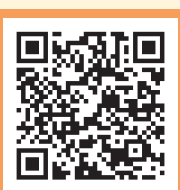
かかりつけ医検索システム

かかりつけ医と当院の医師が密接に連携することで、一人の患者さんに対し、安全で安心な医療を継続して提供することができます。かかりつけ医をお探しの方は、担当の医師又は「患者総合支援センター 地域連携担当(新館1階)」にご相談ください。